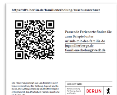
Abbildung 1 - Hier scannen oder klicken

Anschließend kann der Zuschuss direkt online beantragt werden.